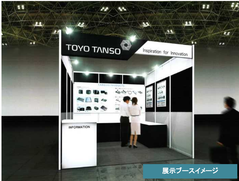
展示ブースイメージ